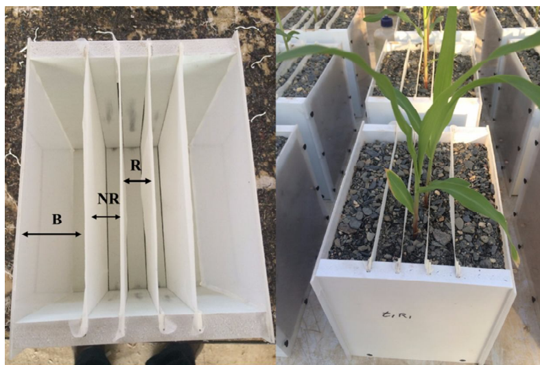
شکل ۱- رایزوباکس مورد استفاده در این پژوهش (R: ریزوسفر، NR: نزدیک ریزوسفر و B: توده‌ای یا غیرریزوسفری).