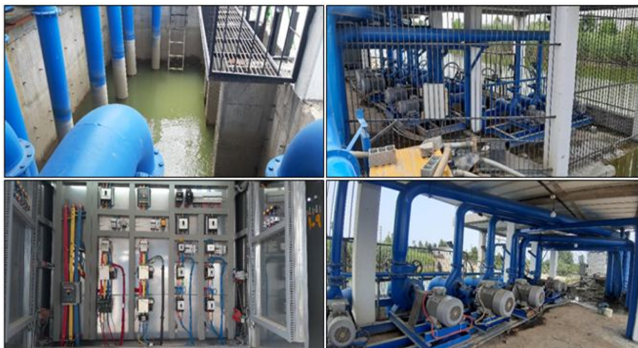
شکل ۲- نمایی از ایستگاه پمپاژ احداث شده در شبکه مورد مطالعه بهنمیر.