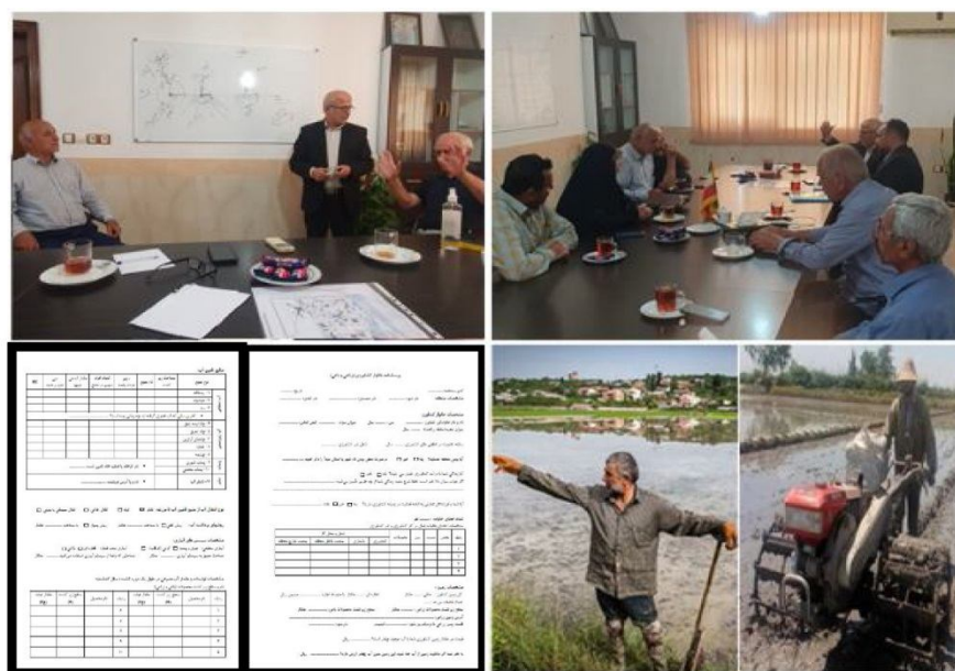
شکل ۱- جلسات و مصاحبات حضوری با برخی از کشاورزان و تکمیل پرسشنامه.

منطقه شرق استان مازندران به مساحت ۸۸ هزار هکتار شامل دشت تجن (۴۵ هزار هکتار)، دشت