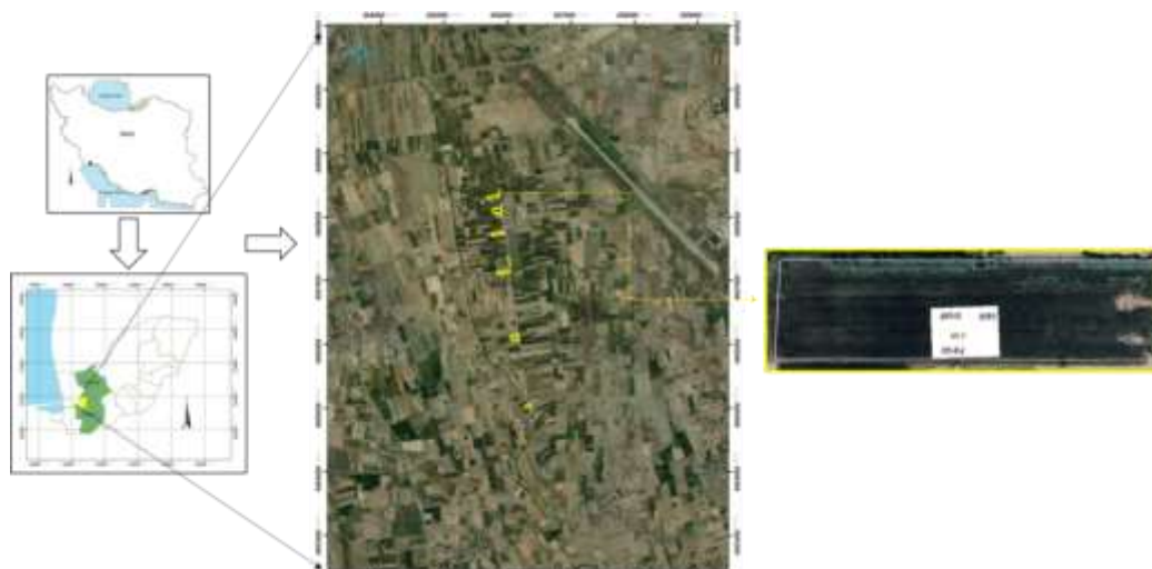
شکل ۱- موقعیت منطقه مطالعاتی و مزارع نمونه‌برداری.

منطقه مورد مطالعه: استان گلستان که در شمال شرق کشور قرار دارد، با مساحتی معادل 20,437/74 کیلومترمربع معادل 1/3 درصد مساحت کل کشور را به خود اختصاص داده است. از منظر جغرافیایی این استان بین 36 درجه و 24 دقیقه تا 38 درجه و 5 دقیقه عرض شمالی و 53 درجه و 51 دقیقه تا 56 درجه و