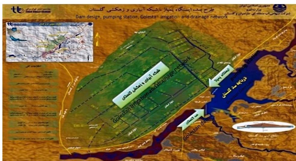
شکل ۲- سیمای طرح شبکه آبیاری و زهکشی سد گلستان.