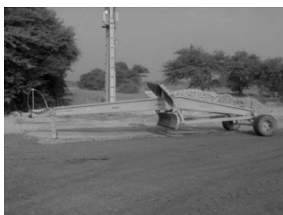
شکل ۱- لولر مرسوم.

وسایل و تجهیزاتی که برای انجام امور مربوط به آزمایش‌ها مورد استفاده قرار گرفتند عبارتند از: تراکتور والترا، لولر مرسوم که توسط شرکت دقت کشت شیراز تولید شده (شکل ۱)، لولر لیزری که توسط شرکت آمریکایی میسکین ۱ ساخته شده (شکل ۲)، چوب، گچ، بیل، متر، زمان‌سنج، مرز بند، موتور و پمپ آبیاری.