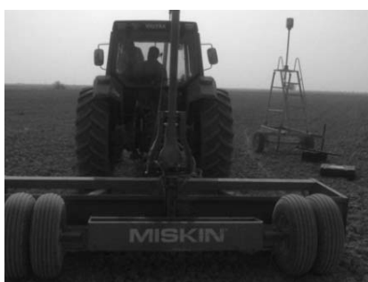
شکل ۲- لولر لیزری در حین انجام کار.