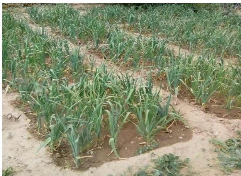
شکل ۱- جانمایی طرح.

جانمایی طرح در شکل ۱ نشان داده شده است. عملیات شخم و تسطیح زمین به‌صورت دستی انجام گرفت و اندازه هر کرت دو مترمربع در نظر گرفته شد. رقم سیر همدان با میانگین عملکرد هفت تن در هکتار و متوسط وزن هر سیرچه پنج گرم انتخاب و سیرچه‌ها با فاصله بین ردیف ۱۵ سانتی‌متر و روی ردیف ۱۲ سانتی‌متر و عمق پنج تا هفت سانتی‌متر کاشته شد. عملیات کاشت در اوایل آبان انجام و پس از آن آبیاری صورت پذیرفت. جهت انتقال آب به