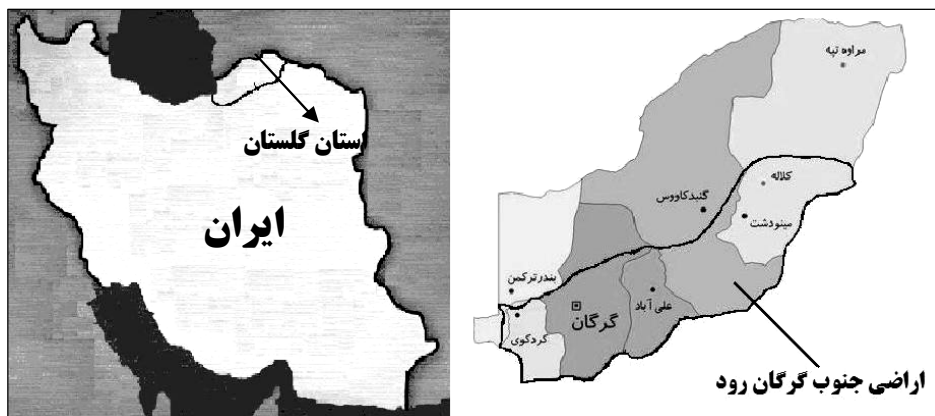
شکل ۱- موقعیت منطقه مورد مطالعه.

اراضی جنوب گرگان‌رود دشتی است به وسعت ۳۳۷۰۰۰ هکتار واقع در استان گلستان که بین طول جغرافیا ۵۳ درجه و ۵۹ دقیقه و ۳۱ ثانیه شرقی و عرض جغرافیایی ۳۶ درجه و ۴۴ دقیقه و ۳۰ ثانیه شمالی قرار دارد. این منطقه از شمال به گرگان‌رود و دیوار اسکندر، از غرب به دریای خزر و از جنوب و شرق به کوه‌های البرز محدود می‌شود. ارتفاع منطقه بین ۲۵-۲۷۰ متر از سطح دریا می‌باشد (شکل ۱).